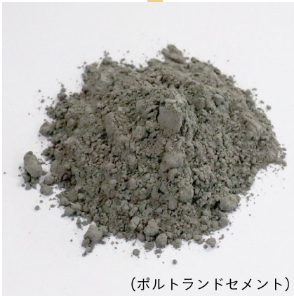
(ポルトランドセメント)

水と反応して固まるため、古くから 接着剤として使用され、現在 でも建築や土木など幅広い現場 に使われています。